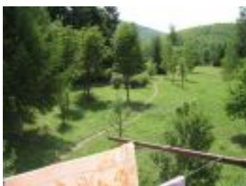
Pogled sa terase