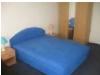
Veca spavaca soba