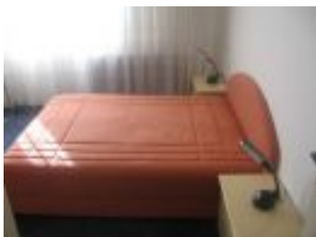
Manja spavaca soba