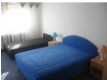
Velika spavaca soba